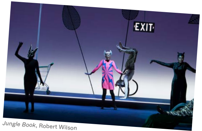
Jungle Book, Robert Wilson